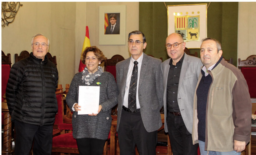
El govern i el Bisbat van oficialitzar la compra

El consistori ha fet efectiva la compra de l'edifici del Centre Parroquial al Bisbat de Girona. Han estat dos anys de converses que han culminat amb la compra de l'edifici on s'ubicava el conegut popularment com a "El Centru", juntament amb el local social de la planta superior i la rectoria nova.