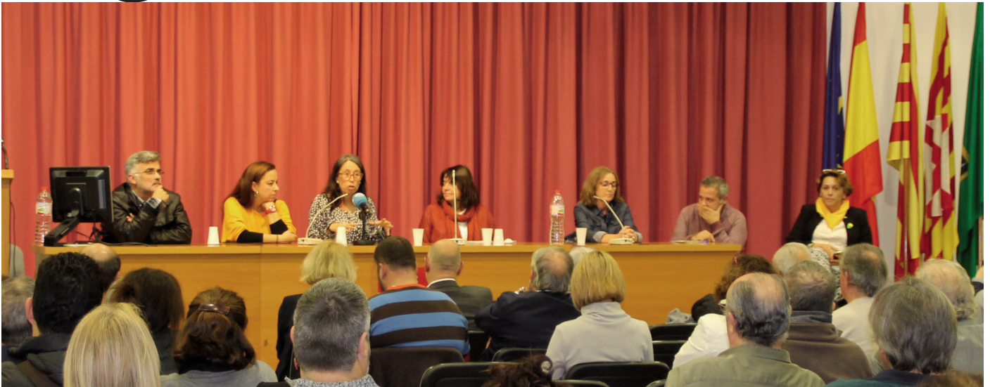
El govern va oferir una presentació de manera pública per explicar els detalls de l'acollida

Una cinquantena de joves migrants d'entre 14 i 17 anys viuen a Canet des del mes passat. El nostre municipi forma part de la xarxa de poblacions que col·laboren en l'acolliment de joves estrangers arribats a Catalunya, sols i sense referents familiars.