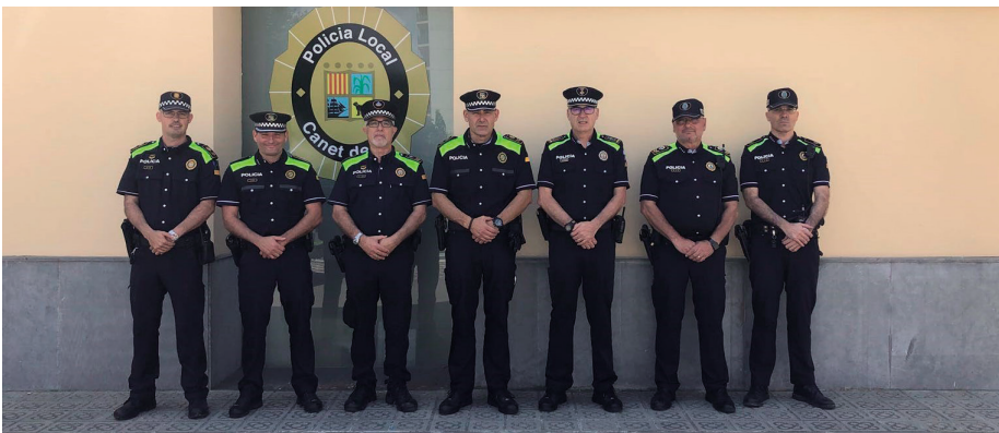
El cap d'Arenys de Munt, el sotscap de Canet, els caps de Sant Pol, Canet, Calella i el cap i sotscap d'Arenys de Mar (d'esquerra a dreta a la imatge) després de la primera reunió amb els uniformes

Des d'aquest estiu, el cos de la Policia Local vesteix d'acord amb la nova uniformitat, sorgida arran del procés d'homogeneïtzació dels uniformes dels 215 cossos de policia local de Catalunya en un sol model. Aquest canvi permet crear una imatge corporativa comuna als diferents cossos de policia de Catalunya, ja que és molt similar a la nova uniformitat del cos dels Mossos d'Esquadra.