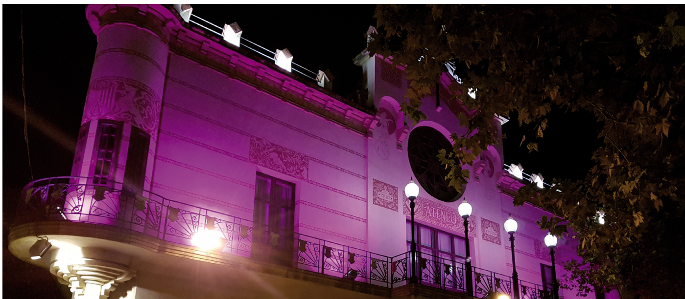
La façana de la biblioteca, il·luminada de rosa contra la violència de gènere

El municipi s'ha adherit a la jornada del 25-N, Dia Mundial de l'Eliminació de la Violència Contra les Dones amb un ampli ventall d'activitats que han tingut un bon seguiment: xerrades, tallers d'autodefensa i la projecció d'una pel·lícula han estat algunes de les més destacades.