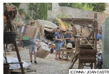
Muntatge de decorats al carrer de Ferran el Catòlic, de Girona.