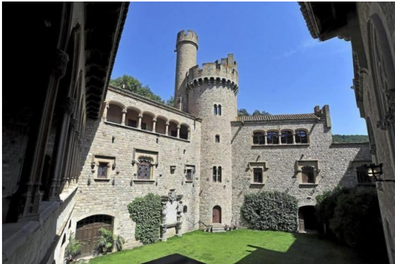
Castillo de Santa Florentina, en Canet de Mar | MARGA CRUZ