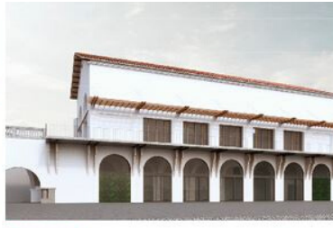
GESTIÓ D'EQUIPAMENTS CULTURALS