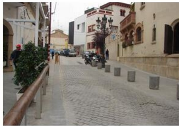
PLA URBANÍSTIC. MILLORA DEL CENTRE HISTÒRIC