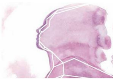
FEMINISME I IGUALTAT