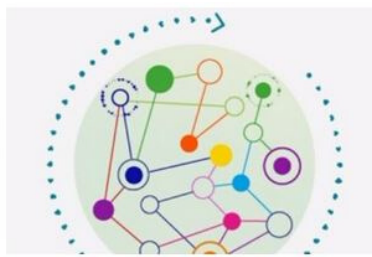
ECOSISTEMES EDUCATIUS LOCALS 360°