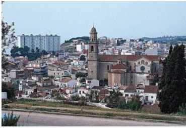
PLA ESTRATÈGIC 2030