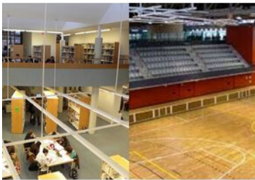
NOUS EQUIPAMENTS: BIBLIOTECA / PAVELLÓ