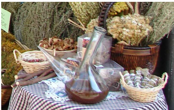
Il·lustració Teresa Brugardó

Horari: dimarts de 19.00 a 21.00 hores, de dimecres a divendres de 17.00 a 21.00 hores, dissabte d'11.00 a 14.00 hores i de 19.00 a 21.00 hores, diumenge de 19.00 a 21.00